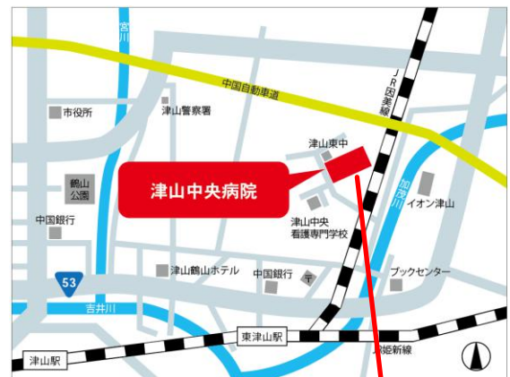
津山中央病院構内図