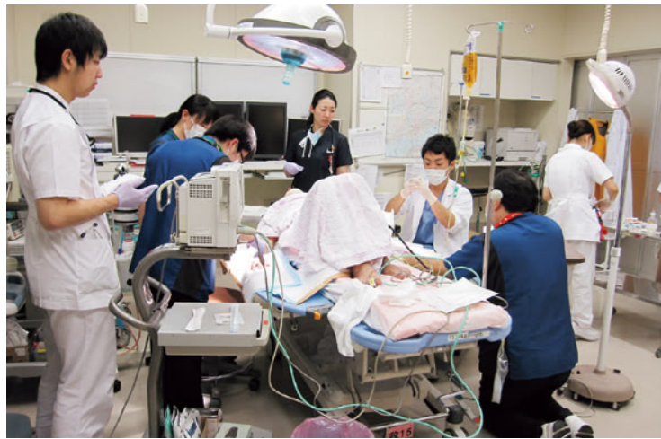
高度救命救急センター