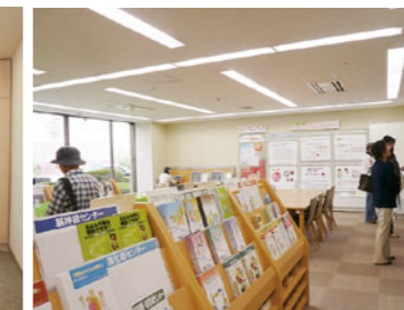
患者図書室「健康・情報ひろば」

病棟・外来は、臓器・機能別センターの構成になっており、センターごとにわかりやすいテーマカラーを設定しています。病室は、ゆとりある個室を中心とした構成で、アメニティとプライバシーに配慮した設計になっています。全ての病室で無料Wi-Fiに接続でき、機能的で明るい、清潔な環境を整備しています。