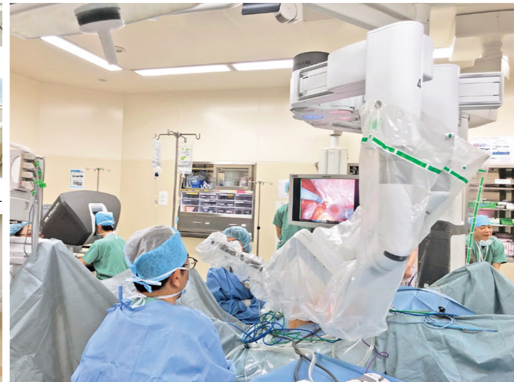
ロボット支援下内視鏡手術