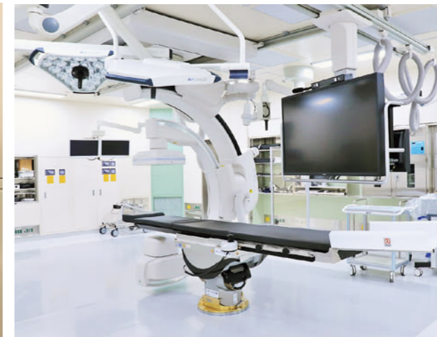
ハイブリッド手術室