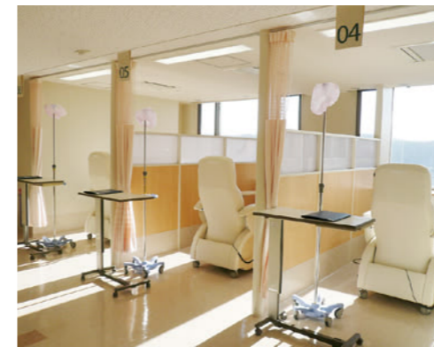
通院治療センター