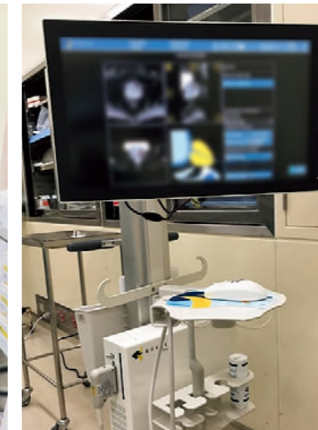
MRI-超音波融合画像ガイド下前立腺標的生検装置