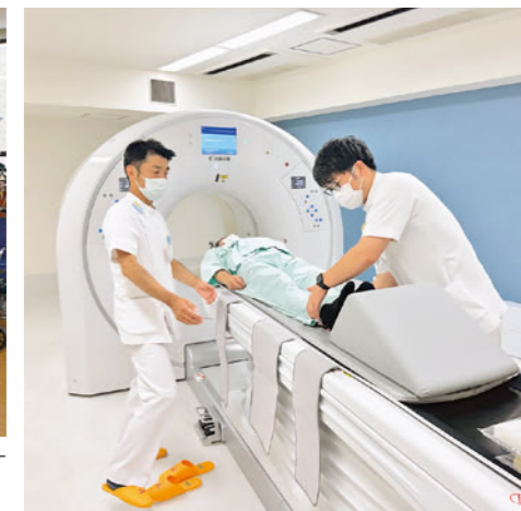
高精度放射線治療装置