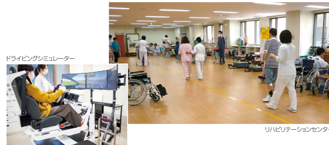
リハビリテーションセンター