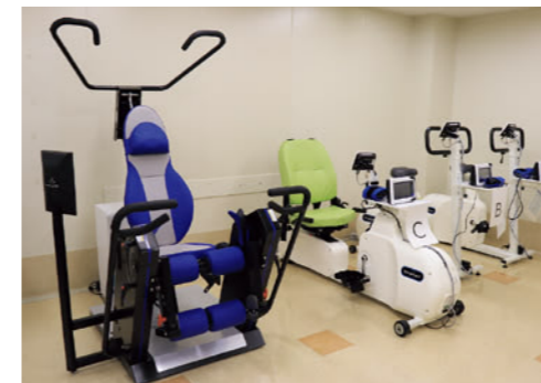
心疾患リハビリテーショントレーニング室