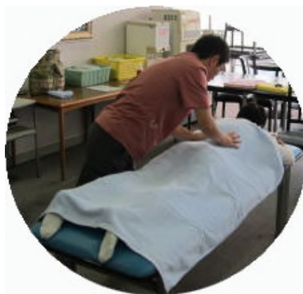
日ごろの疲れが癒されました。

*お詫び 今年度は都合により予定していた陶芸教室が急遽中止になりました。 楽しみにしていた方々に心よお詫び申し上げます。