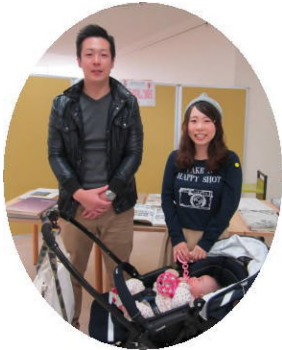
赤ちゃん連れの卒業生