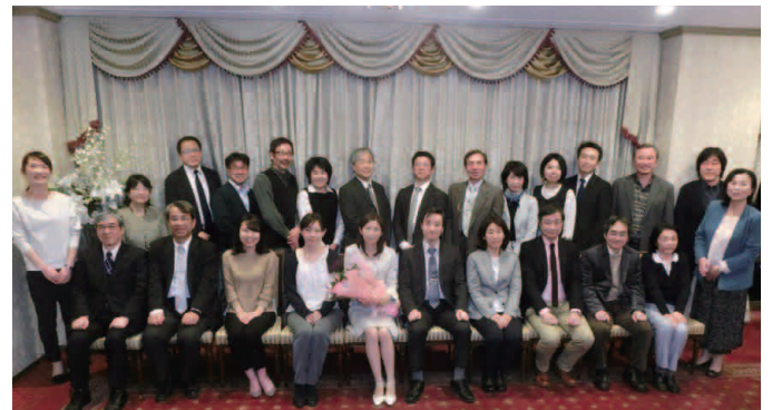
臨床検査学科・臨床検査科 教職員歓迎会にて (2017年4月13日、スイートタウン・レストラン シャルル)

医療短期大学には「松丘会」という同窓会が連綿たる歴史と伝統を紡いでまいりました。新生臨床検査学科は、医療短期大学同窓会の充実した人脈・ネットワークをうまく継承しつつ、そこに新たな歴史を重ねていきたいと考えております。各方面におかれましては、何卒ご支援・ご協力のほどよろしくお願い申し上げます。