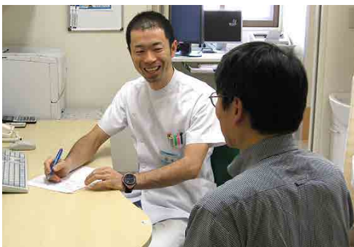
生活習慣や体力などに合わせた運動をオーダーメイド

病院・クリニック、健康増進施設（健康増進センター、フィットネスクラブ等）、自治体、高齢者福祉施設などにおいて、一人ひとりの健康レベルの維持・増進をめざした、安全かつ効果的な運動プログラムの作成と指導を行う「個人の健康を支えるエキスパート」である。