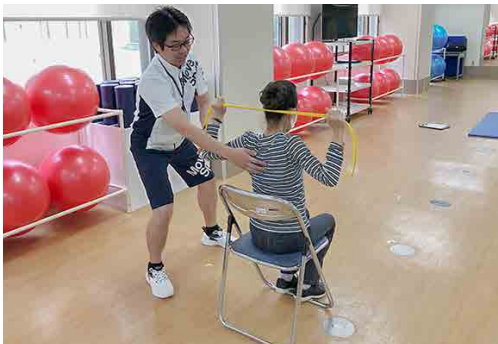
安全や効果に配慮した運動指導