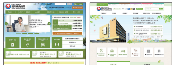
ウェブサイト リニューアル前