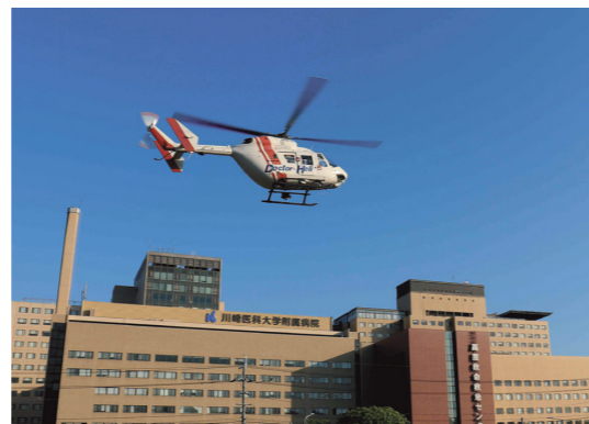
川崎医科大学附属病院(倉敷市)

川崎医療福祉大学と隣接する「川崎医科大学附属病院」、岡山市中心部にある「川崎医科大学総合医療センター」。本学の学生は、最新の医療機器を備えたこれら2つの大学病院の充実した環境で、質の高い実習を行っています。実習においてさまざまな職種との医療スタッフと関わること、チーム医療の一員としての自覚を育み、将来即戦力として活躍できる人材の育成に取り組んでいます。臨床現場で働く看護師から豊富な経験に基づいた実習指導を受けることにより、現場で使える生きた知識や高い技術を身に付けることができます。