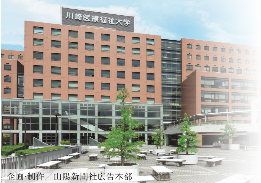
企画・制作/山陽新聞社広告本部