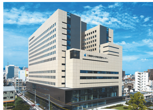
川崎医科大学総合医療センター(岡山市)